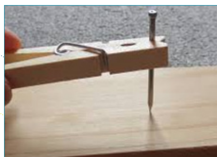
Auxiliar para segurar pregos ao utilizar martelo