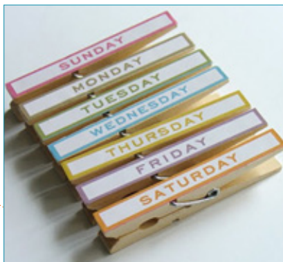
Lembretes para utilização de documentos

Se necessário, para ilustrar novas utilizações para o objeto, mencione e mostre figuras como as que se seguem: