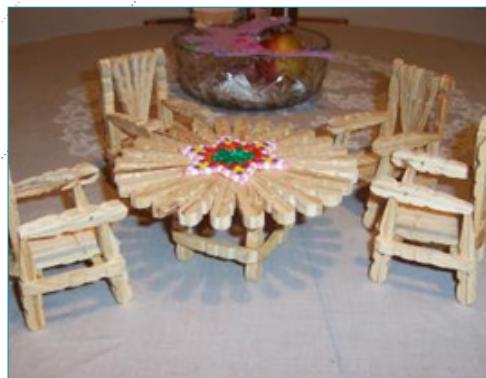
Construção de mobiliário miniatura