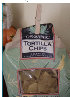
Fecho de sacos de alimentos